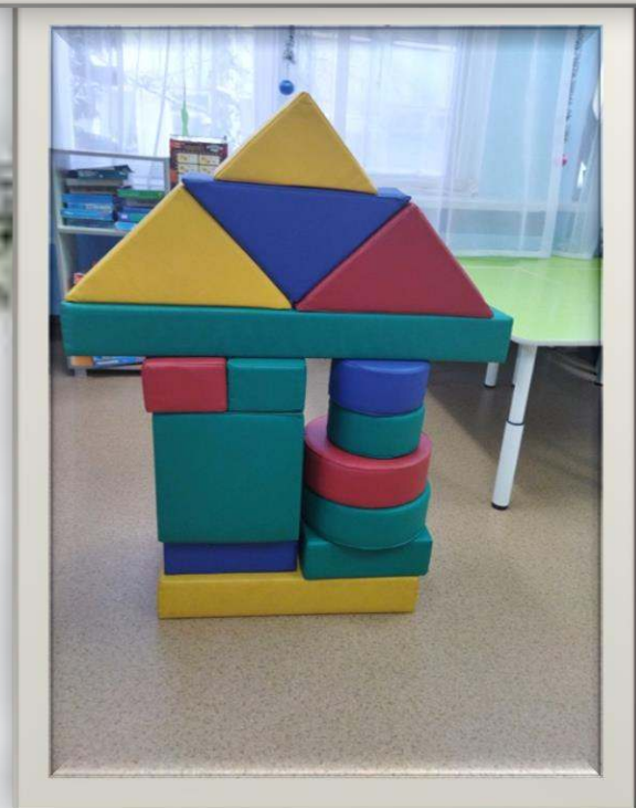
ЕЛОЧКИ Конструирование из мягких модулей